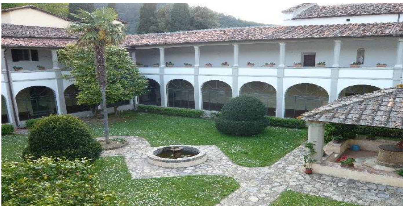
Convento di San Cerbone di Lucca